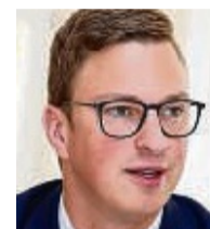
Bürgermeister Andre Stenda Oberbreitzbach